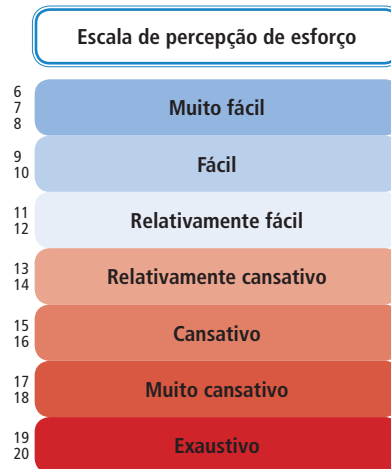
Figura 2. Escala de Esforço Percebido de Borg

Desse modo o programa de caminhada deverá ter os parâmetros demonstrados no quadro 15.