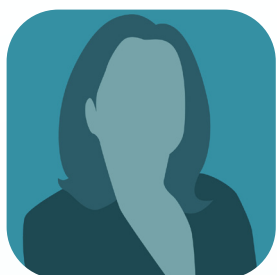
Roxana Knobel (SC)

Gestão 2020 - 2023 Atualizado em 01/06/2021